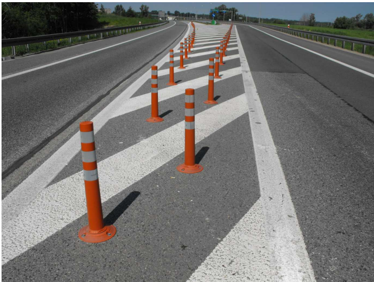
Rys. 1. Słupek poliuretanowy rozdzielający