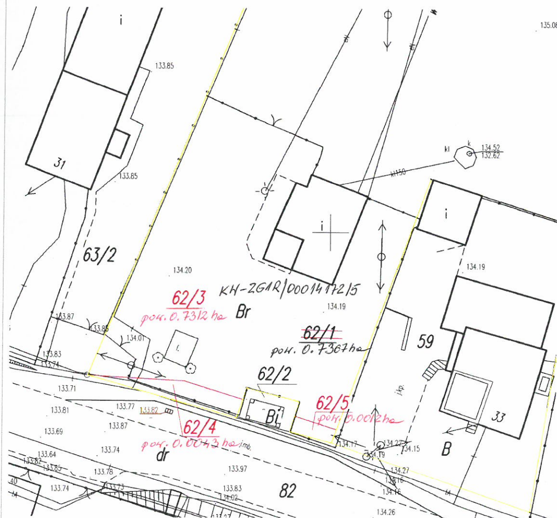
Rysunek poboczny skala 1: 2 000