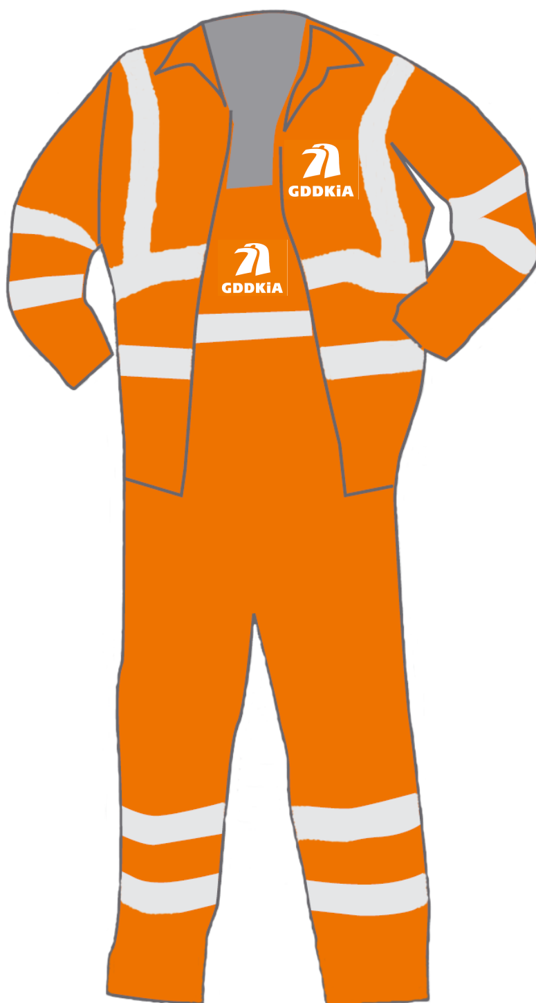
ubranie 2-cz. letnie, zimowe- przód