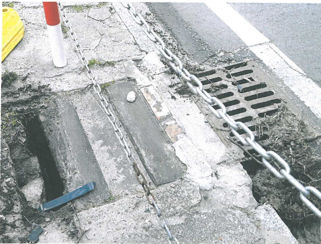
DK 29, Cybinka km 24+500 strona lewa