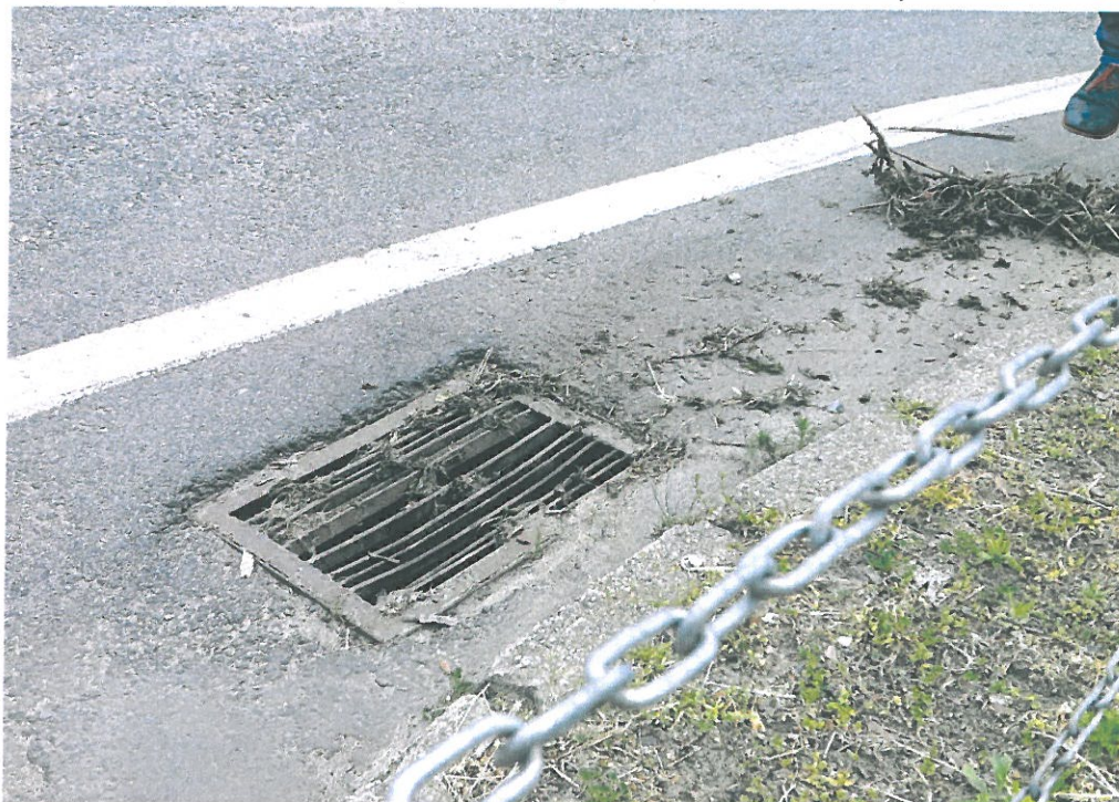
DK 29, Cybinka, km 24+500 strona prawa